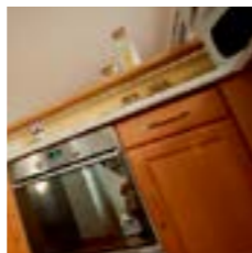
COCINA Y BAÑO